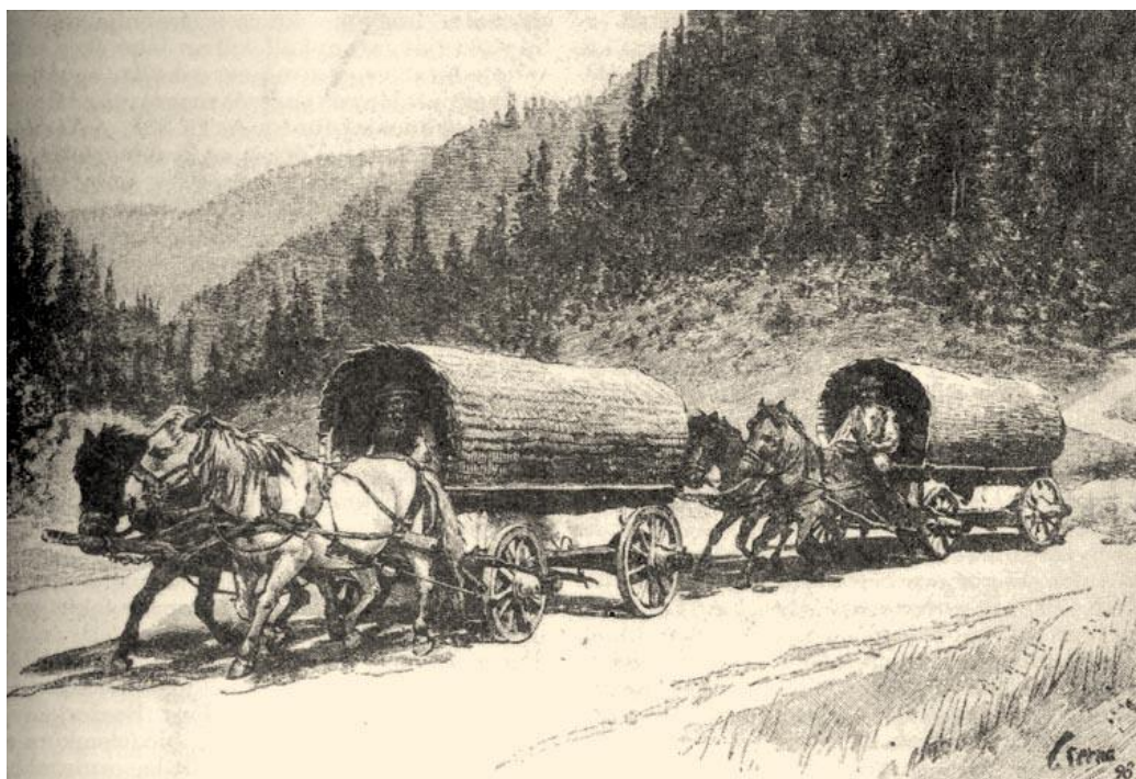
Ekhós szekerek fonott kocsi-ernyővel

„Szokás levágni, azután fedésnek, mint a gyékényt fonásra (mészáros kosár, kocsi-ernyő, sátorgyékény), szobák kibéllelésére használják. Fonásra a Sc. silvaticus L. és Sc. maritimus is használható, de ezek alacsonyabbak.” ( A Pallas nagy lexikona)